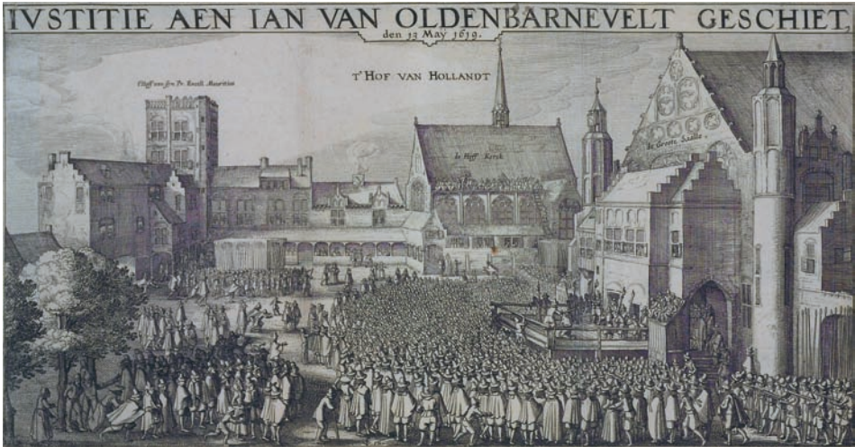
Afb. 3 Het Binnenhof in Den Haag, met in het midden de hofkerk die in de zeventiende eeuw dienst deed als kerk voor de Waalse gemeente van Den Haag.